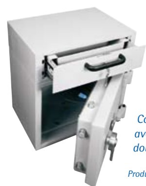
Coffre-fort modèle 602 avec tiroir délestage à double mouvement.